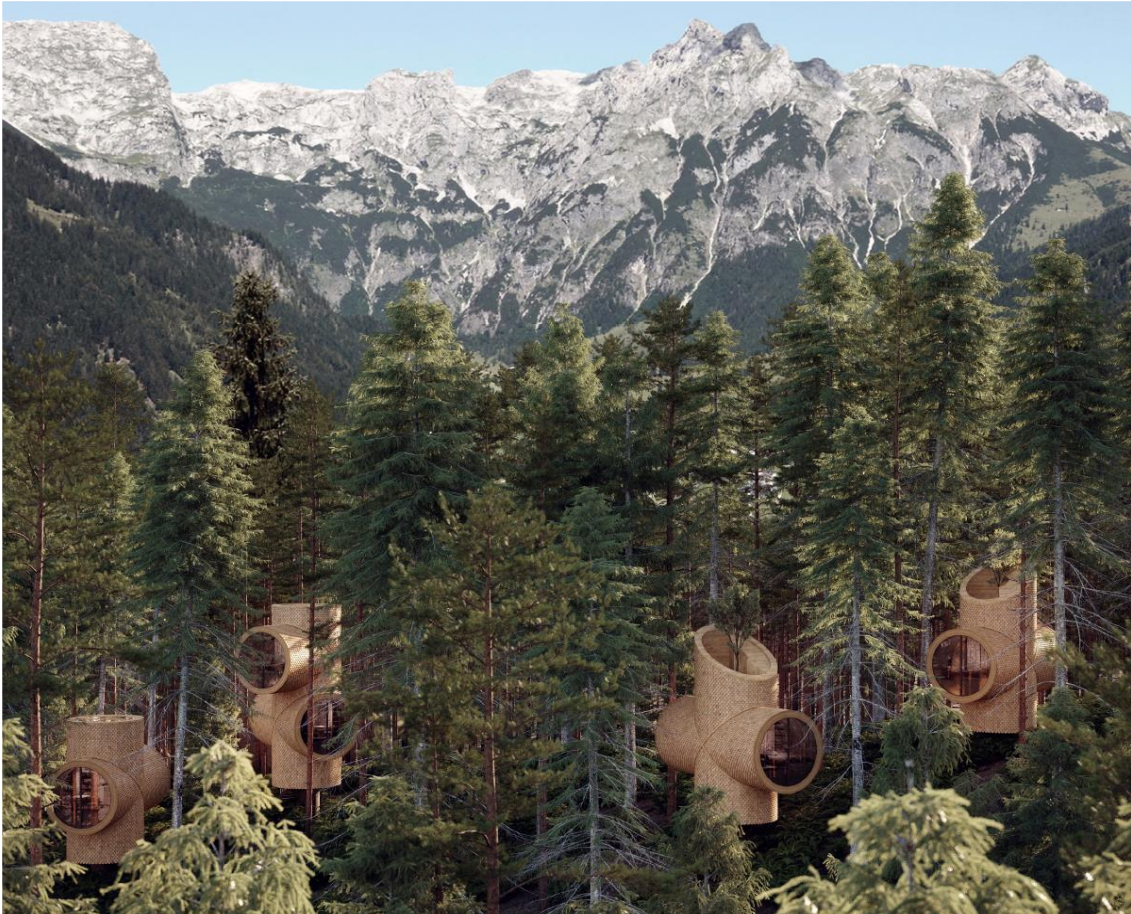
Erstes Schaubild der geplanten Anlage

Den gesetzlichen Bestimmungen zufolge ist über geplante Änderungen des Räumlichen Entwicklungskonzeptes die Bevölkerung in angemessener Weise zu informieren. Es besteht die Möglichkeit, sich bis 02.05.2021 im Rahmen eines Termins im Gemeindeamt Werfenweng noch näher über die geplante Änderung des Räumlichen Entwicklungskonzeptes und über das gegenständliche Projekt zu informieren. Terminvereinbarungen sind erforderlich – Telefon 06466 414.